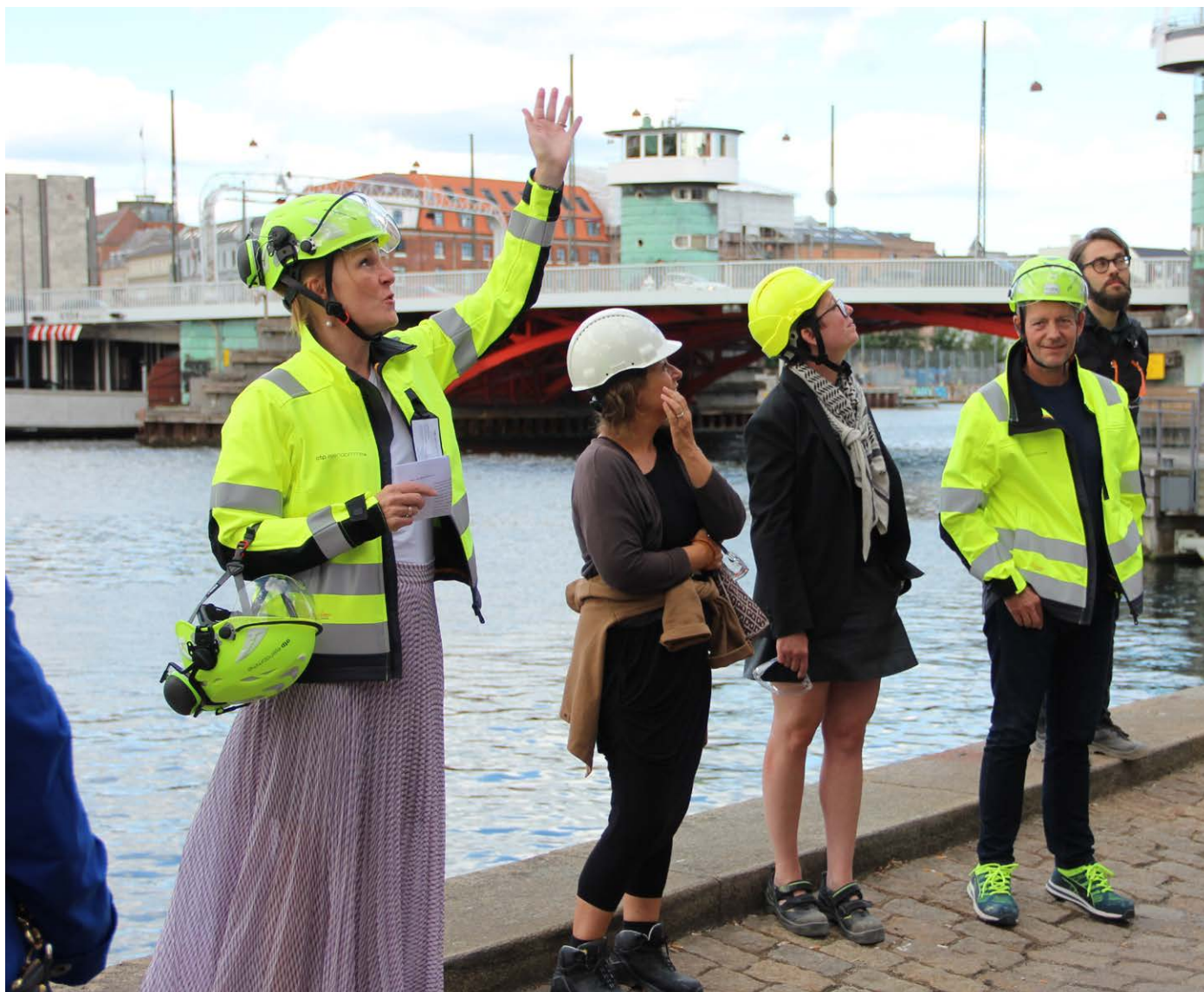
Repræsentanter for NCC og ATP. På havnepromenaden kommer der til at være restaurant, café og bar, hvorfra man kan se ind i hotellets fitness center og restaurantens køkken.