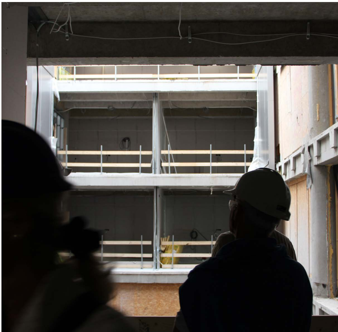
I midten af bygningen er der lavet en lysskakt, som giver dagslys til de inderst liggende gange. Den vil være aflukket med begrønning i bunden.