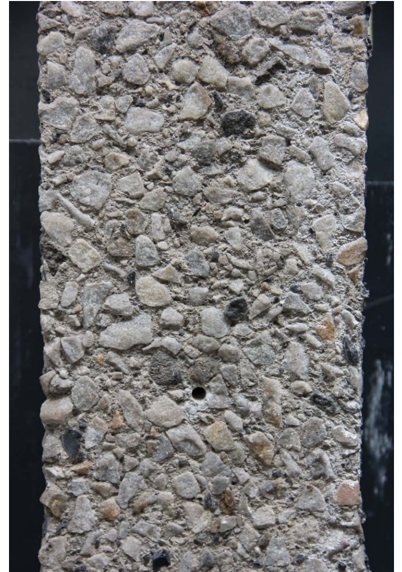
Den bærende konstruktion bliver bevaret i facaden, men bygningen bliver efterisoleret.