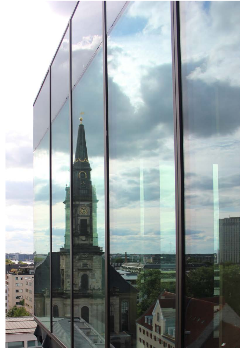
Københavns skyline spejler sig i den transparente top, hvorfra der er udsigt til det meste af byen.